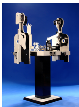
VITALI GAMBAROV CHEES /wood/ metal/ /ceramic/ 68" x 40" x 29" 2008