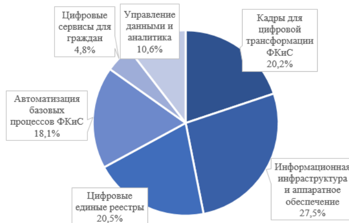
Рис. 3. Значения компонентов Индекса цифровой трансформации сферы ФКиС по России в 2020 году (составлено по данным Министерства спорта РФ [6, с. 4])

существующее состояние и тенденции изменения данной сферы. Так, на рисунке 3 представлены компоненты индекса цифровой трансформации сферы физической культуры и спорта в целом по России.