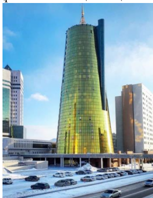
1 Сурет [1]

Белсенді пластик пластмассасы бар ақшыл бет жағында нүктелі терезе ашылымдары бар трапециялы орнын және орталық бетіндегі тар сырғып тұрған шындары бар протездік пилондар түрінде негізгі көлемді белсенді пластикі бар Қазақстан Парламенті Мәжілісінің көп қабатты ғимараты (4-сурет) кем емес.