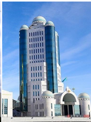
3 Сурет [3]