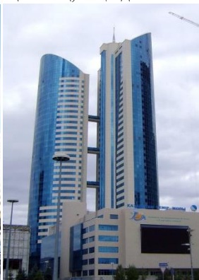
2 Сурет [2]