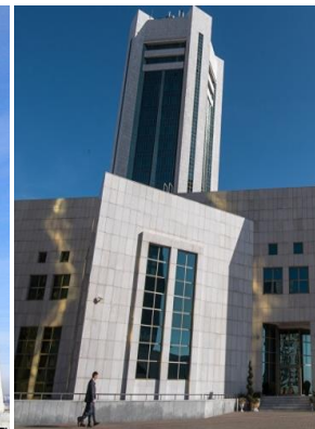
4 Сурет [4]

Ақ түсті ғимараттың үстіңгі қабатында екі параллельді параллель жолақтар бар, олардың үстіне екі горизонтальдық призмалық өрнектердің фризасы бар, олар бір-біріне ілулі тұрған.