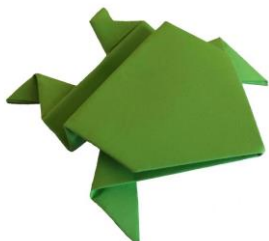
Рис. 1. Лягушка

Искусство оригами — интригующая загадка, и она манит каждого ребенка невероятными превращениями обыкновенного квадратика бумаги. Это даже не фокус, это — чудо!