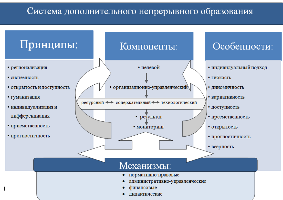
Рисунок 3. Принципы, компоненты, механизмы и особенности системы дополнительного непрерывного образования.

распространение образовательных услуг за счет внедрения и продвижения дистанционных технологий; созданы условия для закрепления молодых кадров в вузе; вуз стал образовательным системообразующим центром, в котором можно не только получить качественное образование, но и разного рода консультации высококвалифицированных специалистов; вуз стал открытой площадкой для всего населения.